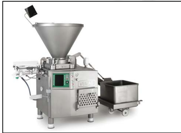
DP14E mit DHV841