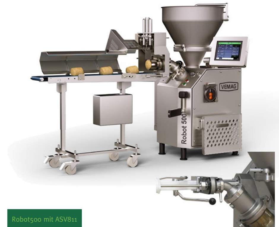
Robot500 mit ASV811