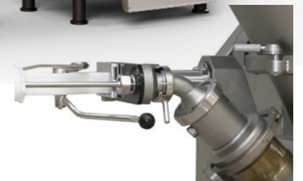
Robot500 mit Füllwolf 980